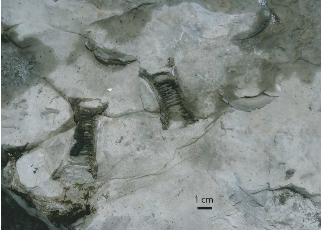
Detailaufnahme einzelner Wirbel von Cretoxyrhina sp. In der Seitenansicht sind die strebenförmigen Verknöcherungen deutlich erkennbar.